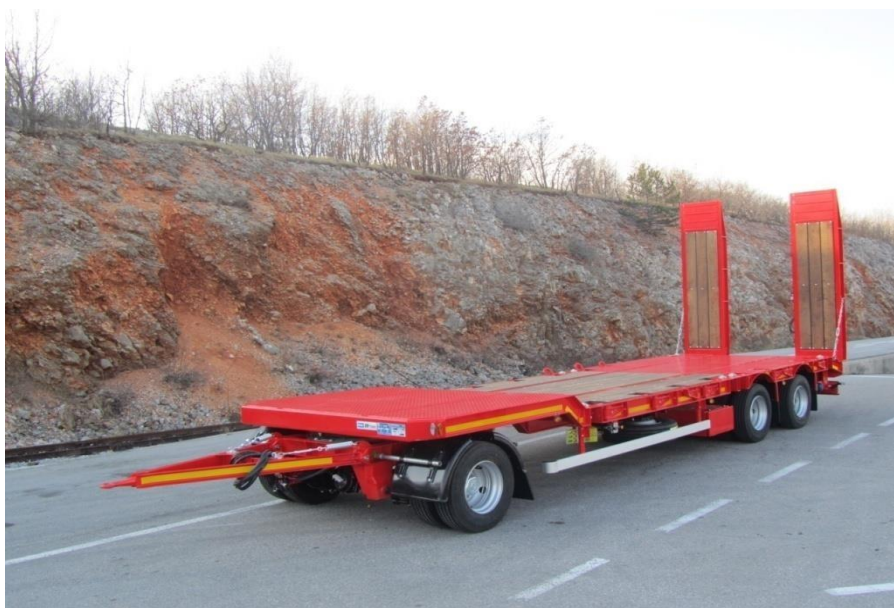
Slika br. 4. Niskonoseća prikolica nosivosti 30t

U planu je nabavka niskonoseće prikolice nosivosti 30t. Prikolica će se koristiti za prevoz građevinskih mašina radi bržeg, efikasnijeg i sigurnijeg transporta do mjesta izvođenja radova.