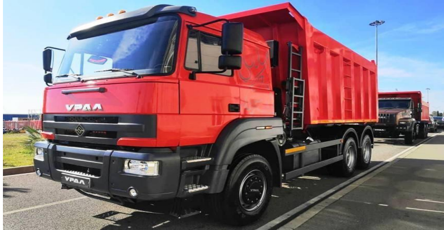
Slika br. 3. Kamion nosivosti 15t

U 2025. godini je izvršena nabavka jednog kamiona nosivosti od cca 15 tona, a takođe u 2026. godini shodno mogućnostima planirana je nabavka još jednog kamiona nosivosti cca 15 tona koji bi bio višestruko koristan, kako zbog efikasnosti i operativnosti, tako i zbog ekonomičnosti. Zbog nosivosti i kapaciteta nabavka još jednog kamiona bi u mnogome olakšala aktivnosti na održavanju i nasipanju seoskih puteva.