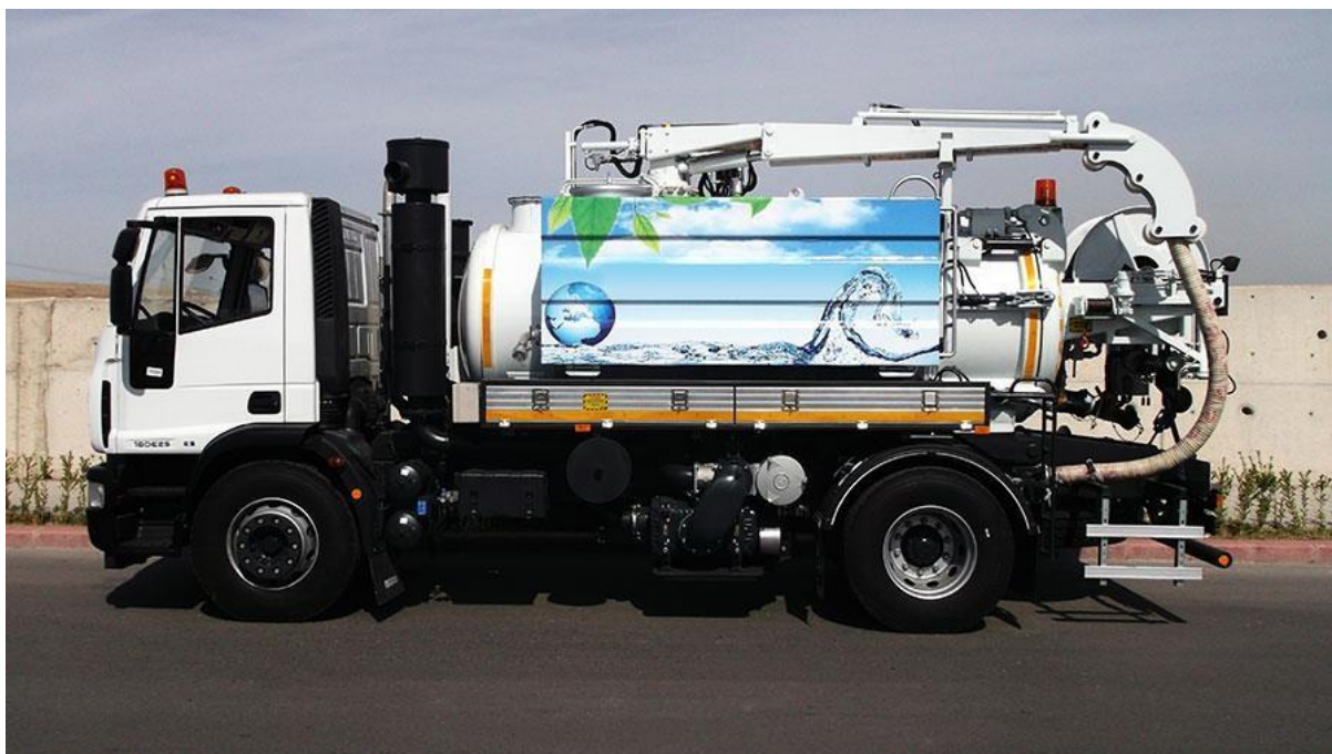
Slika br. 1. Canal Jet