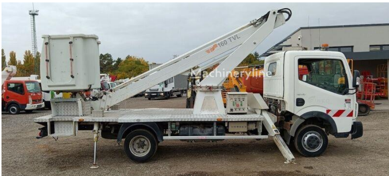
Slika br. 5. Auto dizalica - korpa

Shodno finansijskim mogućnostima planirana je nabavka i auto dizalice sa platformom za rad na visini – korpe koja bi služila za radove na održavanju javne rasvjete čija će se ispravnost održavati iznad 90%.