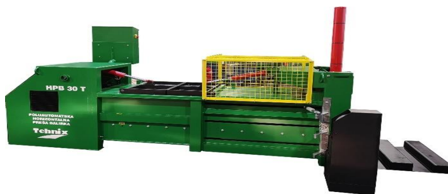
Slika br. 2. Poluautomatska presa sa balirkom

Postojeća transfer stanica sa reciklažnim dvorištem je opremljena sa poluautomatskom presom, HPB – 35 sila potiska 350 KN , masa bale do 400 kg., koja je obezbjeđena preko IPA projekta BEST Saradnja u upravljanju otpadom – Do održive životne sredine.